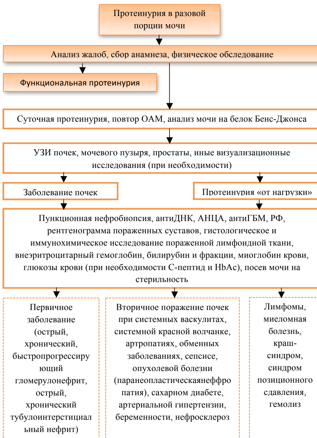
Рис. 3. Алгоритм дифференциальной диагностики протеинурии: антиДНК – титр антител к ДНК, АНЦА – титр антител к цитоплазме нейтрофилов, антиГБМ – титр антител к гломерулярной базальной мембране, РФ – ревматоидный фактор, НвАс – гликозилированный гемоглобин